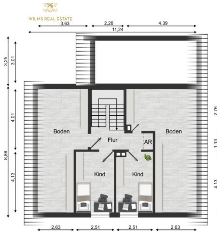
Grundriss Dachgeschoss (Grundriss)