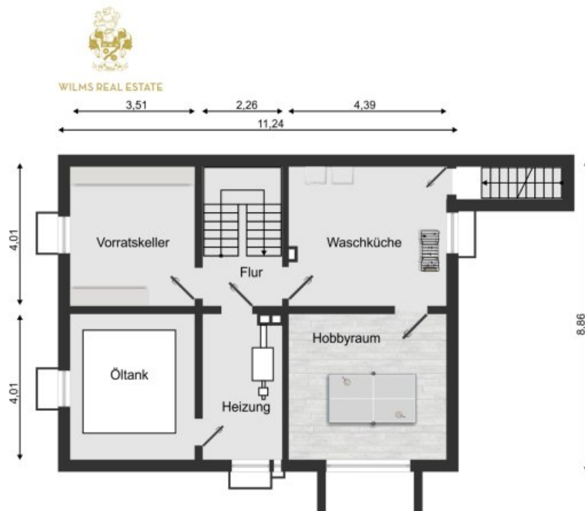
Grundriss Kellergeschoss (Grundriss)