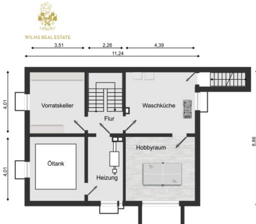
Grundriss Kellergeschoss (Grundriss)