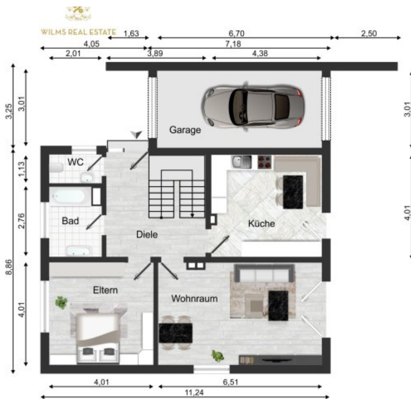
Grundriss Erdgeschoss (Grundriss)