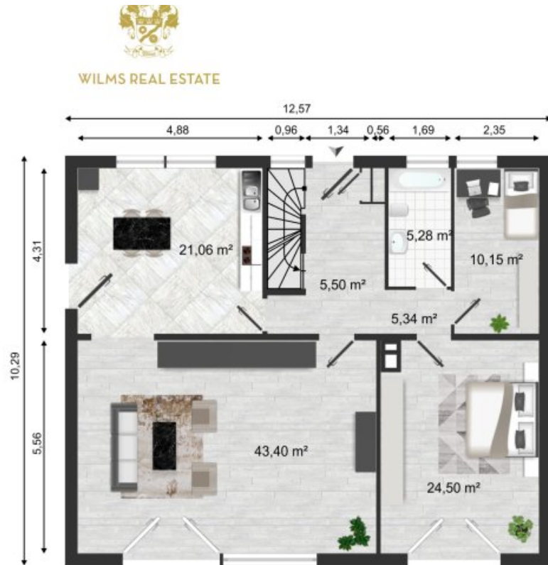
Grundriss Erdgeschoss (Grundriss)