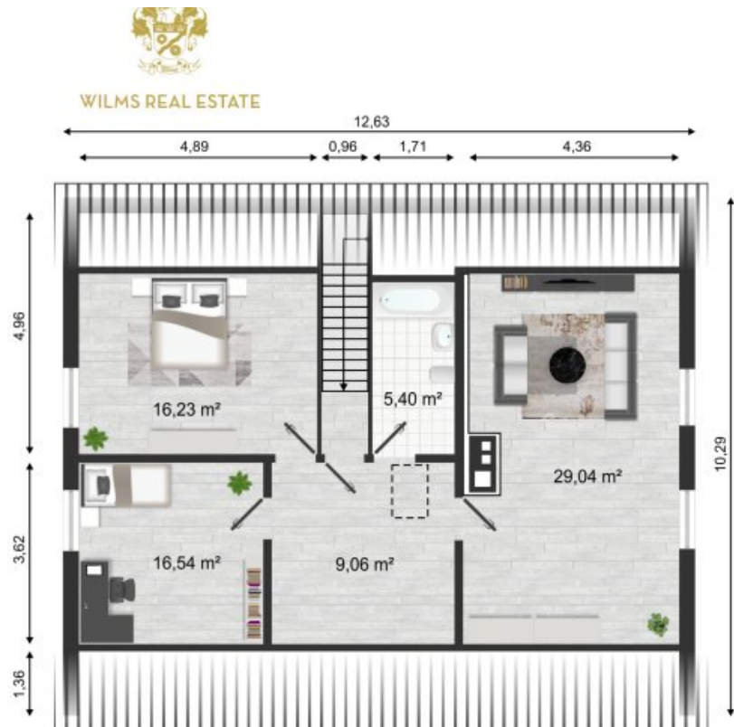
Grundriss Dachgeschoss (Grundriss)